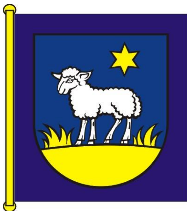
Príloha č. 6 : Štandarda primátora